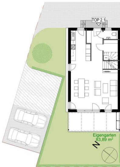
Erdgeschoss TOP 2.1